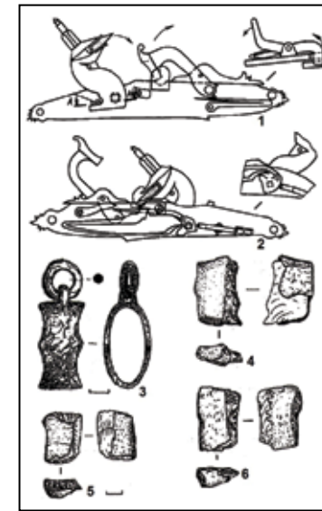
Рис. 3. Механізм дії кременінно-ударного замка «голландського» типу (1, 2) і предмети холодної (3) та ручної вогнепальної зброї (4-6) з Богородицької фортеці (1, 2 – за Л. Маяковською, 3-6 – за І. Ковальовою, В. Шалобудовим, В. Векленком).

Таким чином, у 2013-2014 рр. на території Хотинської фортеці було виявлено досить важливі предмети холодної та ручної вогнепальної зброї. Вони дають важливу інформацію про побутування на території Хотинщини європейських зразків зброї, а також дозволяють прослідкувати розвиток військової справи населення Хотина в XVI-XIX ст.