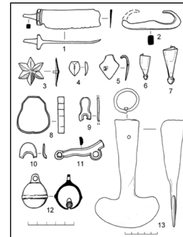
Рис. 3. Вироби з чорного (1, 2, 13) та кольорових (3-12) металів

Окремі порцелянові чаші з незначним кобальтовим розписом по білому фоні зсередини та коричневим блискучим тлом ззовні попередньо можна пов'язати із виробами західноєвропейських майстрів (діаметр вінець – 7,5 см; діаметр денця – 3,3 см; висота – 4,7 см) (рис. 2, 1). Так, аналогічні імпорти відомі серед матеріалів Самарі – Богородицької фортеці [3, с.101, табл. 9, 9]. Цікаво, що надзвичайно схожими до них за стилем оформлення є деякі напівфаянси з археологічних матеріалів Хотинського замку, що, з огляду на значно нижчу якість тіста й примітивніший розпис, можна розглядати як турецьке наслідування чи підробки західноєвропейських зразків.